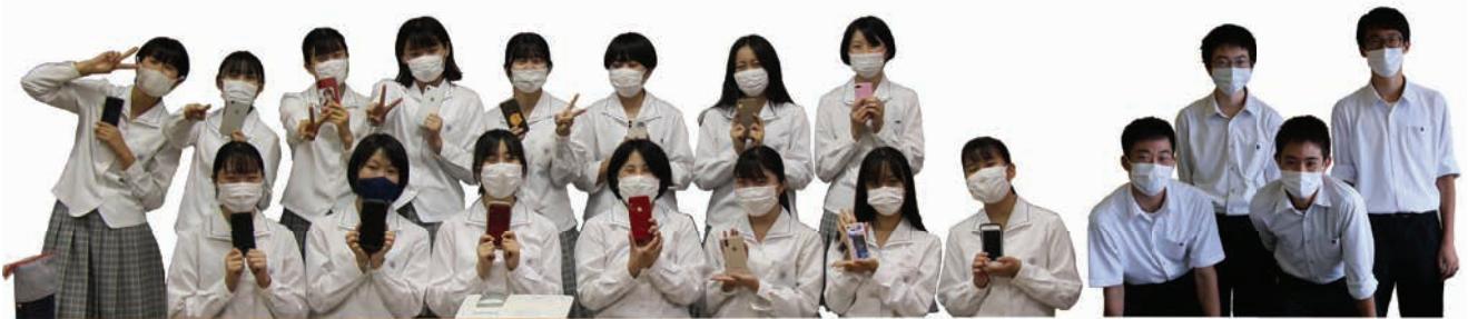
▲ “高校生もまちの魅力を発信し隊” 光丘高校、光高校の生徒の皆さん

インスタグラムをフォローして、「#ひかりの光」と「#(撮影場所)」を付けて投稿 ※詳しくは、21頁のQRコードを参照