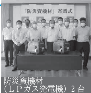
防災資機材 (LPガス発電機) 2台