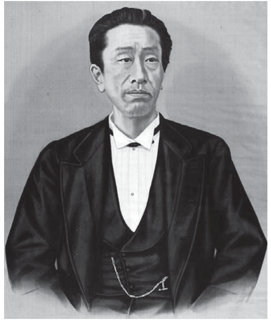
▲手塚律蔵肖像画 (瀨脇家文書A1) 許可番号28-2