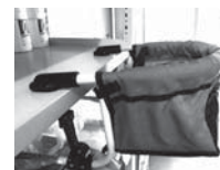
【7】 キャンピングホルダー