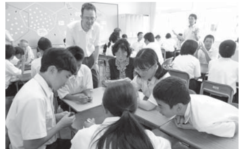
▲英会話教室では、生徒と同じ教科書を使っており、英語の授業に参加することもあります。

大人が学ぶ姿を見せることで、生涯学習の大切さを子どもたちにも伝えることができているようです。あさなえネットのように、学校が子どもたちだけのものではなく、そこに暮らすすべての人にとって「学びの場」になれば素敵だと思いました。