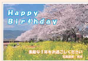
▲メッセージカード