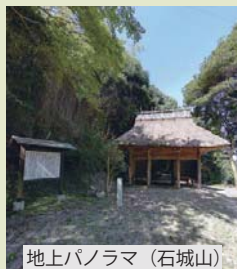
地上パノラマ（石城山）

▼私たちのまち光市は、白砂青松の室積・虹ヶ浜海岸や象鼻ヶ岬、緑豊かな山々など、美しい自然が身近に存在するとともに、海商通りや神籠石に囲まれた石城山、伊藤公記念公園など、自然と歴史・文化に恵まれたまちです。▼こうしたまちの魅力を広く市内外に発信するため、市では、ホームページ上に「ひかりパノラマビュー」を開設しました。▼「ひかりパノラマビュー」は、パソコン上で、航空および地上パノラマ写真や地上VTR（動画）を上下左右、自由に動かすことにより、あたかもその場に居るかのように市内の風景を見渡すことができます。皆さんも、空や地上からのバーチャルツアーをお楽しみください。