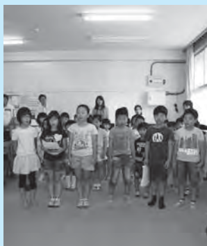
元気にお礼の言葉を述べる 児童代表の皆さん

□申し込み・問合せ 地球温暖化対策地域協議会事務局（環境政策課内） ☎ 0833-72-1400