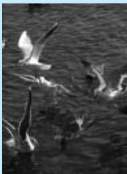
川辺には、ユリカモメのほか、ウミネコやカルガモの姿も見受けられました。

市民や水鳥の憩いの場である島田川では、1月から3月まで、冬の到来を告げる渡り鳥として知られるユリカモメの姿を見ることが出来ます。ユリカモメは、くちばしと足が赤く、ウミネコより一回り小さいのが特徴で、エサをあげると近寄ってくる大変愛らしい鳥です。しかし、残念なことに年々飛来数が減少しており、平成元年には最大約3000羽程度見られたユリカモメも、今年1月時点では最大30羽程度の観測となっています。なぜ減少しているのか、現在は決定的な理由が見い出せない状況ですが、ユリカモメを見ていると、自然環境の保護を訴え掛けているような気がしてきます。皆さん、島田川周辺を散歩の際には、ユリカモメを見守りつつ、自然環境を大切にすることが大切ではないでしょうか。