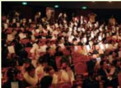
市長とのふれあいトークの様子

1月11日(日)、市民ホールで光市成人のつどいが開催されました。今年の新成人の数は624人。懐かしい同窓生との再会や、多くの祝福に包まれ、会場は大いに盛り上がりました。また、恒例となった「市長とのふれあいトーク」では、光市について聞いたところ、ほとんどの人が好きとの喜ばしい光景も見受けられました。市では「人にやさしく『わ』のまち きっかけ」を目指し、優しく頼れるまちづくりに取り組んでいます。新成人の皆さんも、これから思い描いた世界に向けて進まれますが、ふるさと光で過ごした年月を胸に存分に力を発揮し、