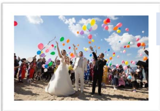
「光市 (sea) でまちぐるみwedding」 (2018年)の様子