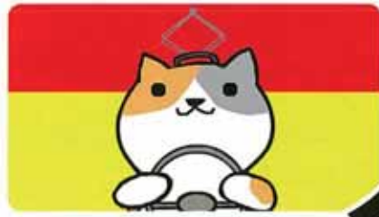
公共交通利用促進キャラクター のりたろう