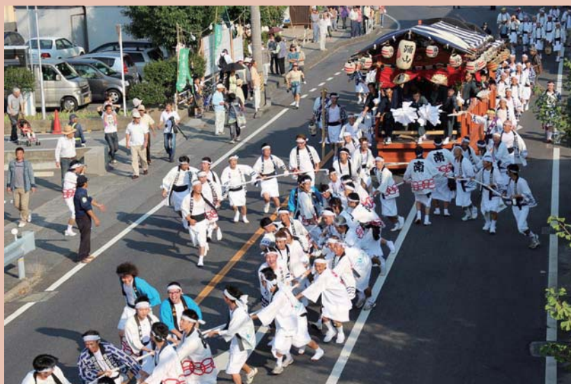
▲今年、大修繕された踊山が若衆とともに、室積のまちを駆け抜けました。