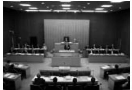
「光市安全・安心都市宣言」を 議会で可決

「おっぴい都市宣言」にふさわしい子育て支援策として、3歳までの子どもとその保護者が遊べる遊具や休憩所を備えた「チャイベビほっとサロン」が9月27日(土)、総合福祉センター(あいぱーく光)にオープンしました。