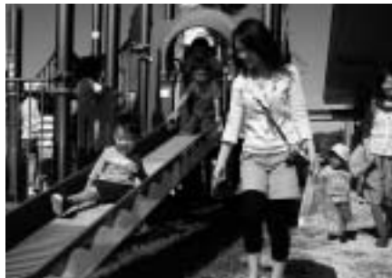
「チャイベビほっとサロン」 がオープン

10月26日(日)に投票された、光市長選挙で市川照氏が第2代光市長に当選しました。また、この選挙から市域を1つの選挙区とした光市議会議員一般選挙では、定数を24人から22人に削減し、新人5人を含む22人の新議員が誕生しました