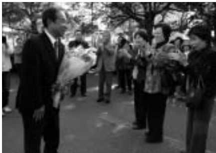
光市長選挙と光市議会議員一般 選挙が行われる

高齢者や障害のある方を対象に、分解を要するものや大きなごみを訪問収集する「ふれあい訪問収集」を6月2日(月)から開始。現在まで50件を超える利用がありました。