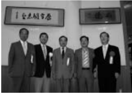
伊藤公資料館開館 11 周年記念 「歴代総理大臣の書」特別展開催

伊藤公資料館開館11周年記念として8月30日(土)から、「歴代総理大臣の書」特別展を開催しました。特別展では伊藤公直筆の書をはじめ、第91代総理の福田康夫氏など歴代総理大臣の書28点を公開しました。