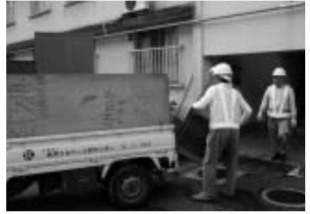
粗大ごみなどの 「ふれあい訪問収集」を開始

“もったいない”という日本古来の文化を継承し、おしゃれで地球環境に負荷をかけないライフスタイルの普及を目指して7月12日(土)「おしゃれな人のふるしき生活」と題したふるしきセミナーを市民ホールで開催しました。