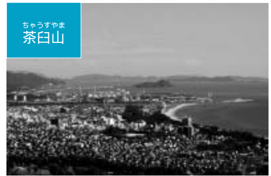
ちゅうすやま 茶白山

誰がいつ、何のためにつくったのか。石城山八合目付近を鉢巻き状に取り巻く神籠石はさまざまな可能性を秘めた私たちの貴重な財産です。