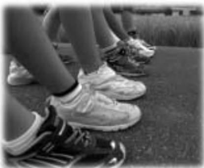
この日、靴を新調した子もいました。 愛用の靴は子どもたちの大事な宝物です。

将来この子たちが成長した時、日常生活のふとした折々に、一緒に散歩したこのふるさとの景色を思い出してほしいですね。これからも、ふるさとの大切さを自らの体験から学んでほしいと考えています」