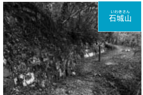
いわきさん 石城山

誰がいつ、何のためにつくったのか。石城山八合目付近を鉢巻き状に取り巻く神籠石はさまざまな可能性を秘めた私たちの貴重な財産です。