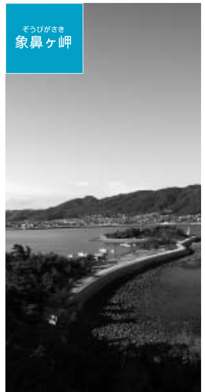
ぞうひがさき 象鼻ヶ岬

つつみ うら 鼓が浦展望台から観た象鼻ヶ岬。影の具合で、まるで象が鼻を上げているように見えませんか。