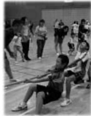
綱引き熱戦の様子

ディスクゲッター・輪投げ (小学生以下) 申込不要、当日気軽にチャレンジしてください。