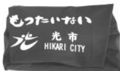
もったいない風呂敷