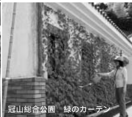
冠山総合公園 緑のカーテン