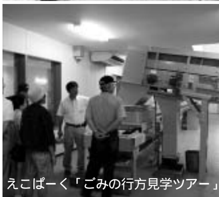
エコパーク「ごみの行方見学ツアー」