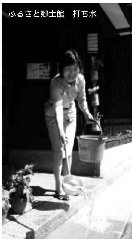
ふるさと郷土館 打ち水