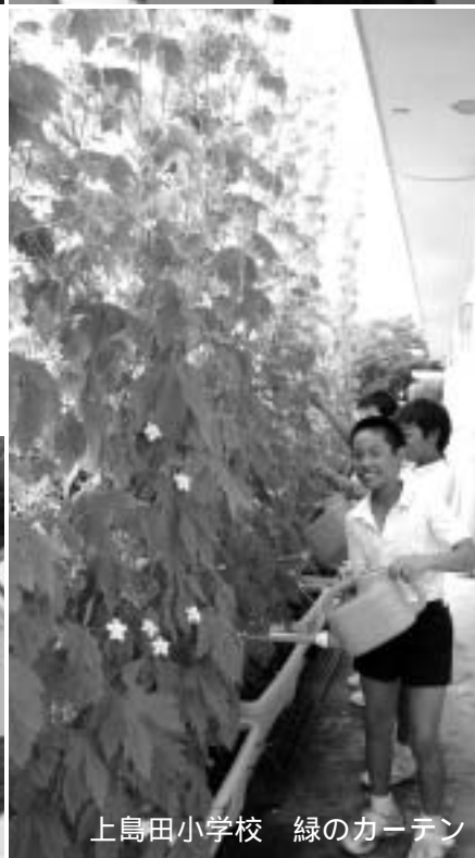
上島田小学校 緑のカーテン