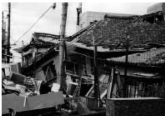
阪神淡路大震災で破壊された家