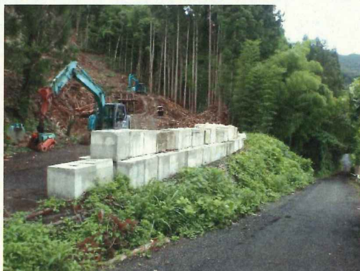
【コンクリートブロックや大型土のうによる堰堤】