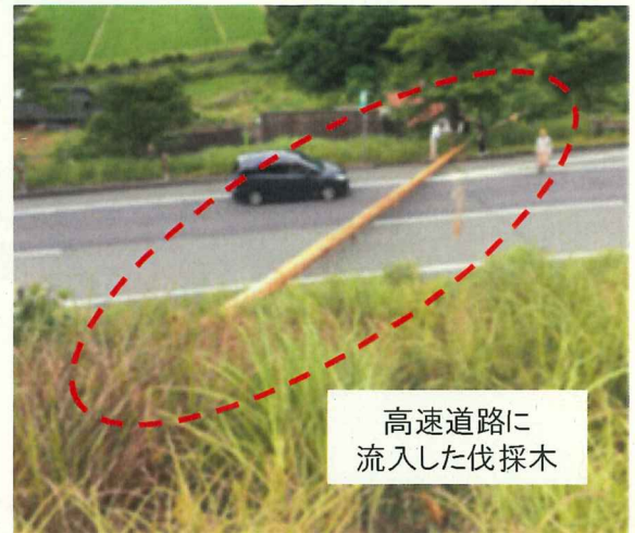
高速道路に流入した伐採木

幸い高速道路をご利用されているお客さまへの直接的被害はございませんでしたが、一步間違えば 重大事故に繋がる事象 であり、法律上、 占有者(所有者)が管理責任を問われる可能性 もあります。