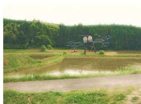
スマート農業機械購入支援事業