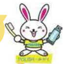
光市健康づくり推進キャラクター「まもるん」