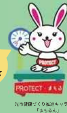
光市健康づくり推進キャラクター「まもるん」

「検診」は特定の疾病を発見するために行われます。しかし、がん検診にもデメリット(不利益)はあり、どのがん検診でも必ずがんを見つけられるわけではありません。また、がんでないのがんの疑いがあると判定(偽陽性)されることもあります。 がん検診の利益、不利益を理解し、利益が上回ると判断したうえで検診を受けることが重要です。