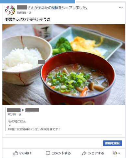
Facebook から応募した場合のシェアイメージ図