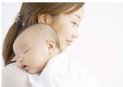
産後ケア事業の無料化