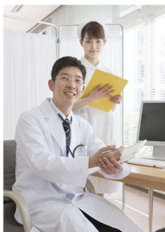
乳幼児・子ども医療費助成事業