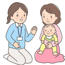
子育て世帯訪問支援事業