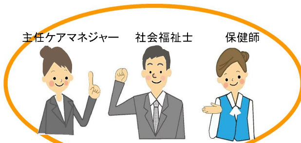
主任ケアマネジャー 社会福祉士 保健師