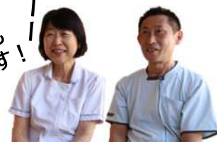
しまた川苑の職員さん