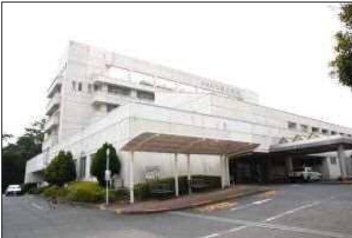
現在の光市立光総合病院