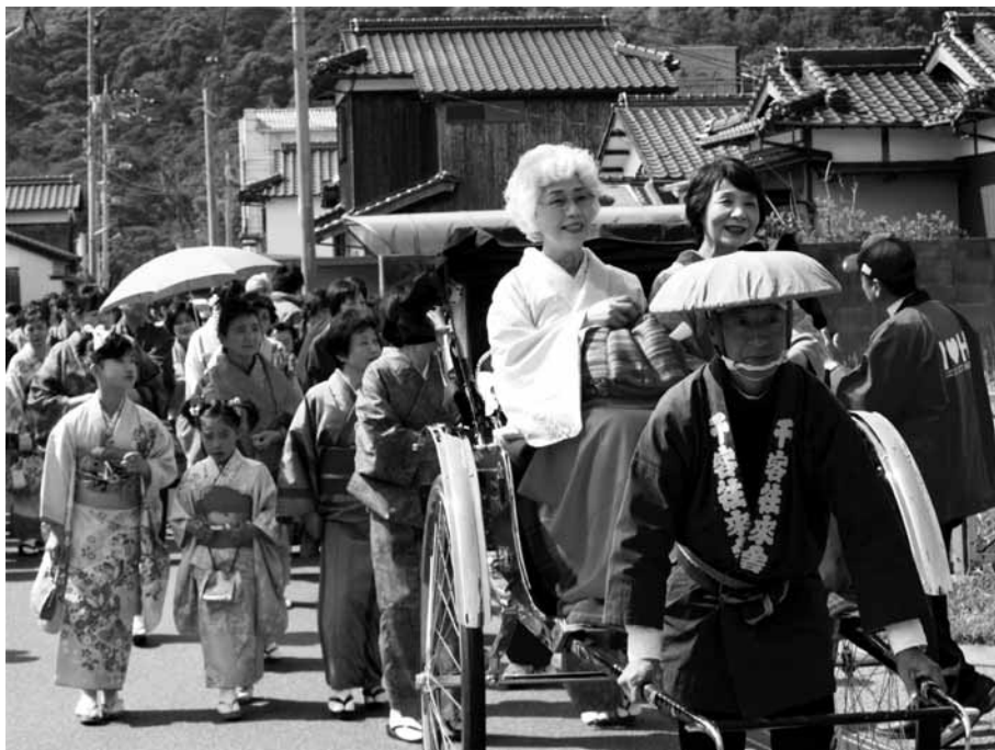
「きものでぶらり in むろづみ」(撮影場所：室積海商通り)