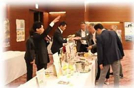
特産品販売も2年ぶり!