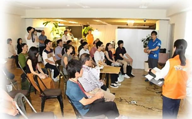
9月29日 移住相談会の様子

次回の出展は来年2月2日(日)の予定です。Uターン等の移住の促進は、ふるさと光の会の目的の一つです。会員の皆様のお力添えがあれば市職員さんも心強いと思いますので、ご都合のつく方はぜひ移住相談会にご参加いただき、光市のPRにご協力をお願いします。