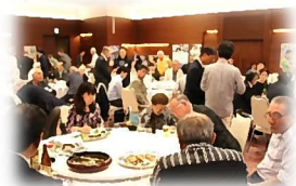
会員の交流も深まりました

今回は、「冠山総合公園」から中継を行い、施設や花木等が紹介されました。公園の人気者の鯉「カープちゃん」は行方不明中でしたが、木登り体験「ツリークライミング」の実演では、木登りする子どもたちと画面を通じて手を振り合うなど、光市との心のつながりを実感することができました。