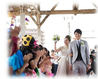
光駅構内で結婚式

光市のシティプロモーションイベント「光と虹のまちぐるみウエディング」が開催され、11月18日にNHKの朝の情報番組で全国放送されました。このイベントは光市の人の温かさややさしさ、豊かな自然などを広く発信することを目的とし、3回目となる今年は、光駅や虹ヶ浜などを舞台に10月20日に行われました。