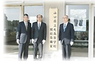
新「光高」の開校準備室を設置

11月1日には、新高校の開校準備室が設置されました。今後、開校に向けて細部にわたる準備が進められる予定です。光市で唯一の県立高校として、その名のごとく、生徒たちが光輝く学校になることを期待したいと思います。