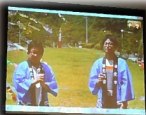
冠山総合公園とリアルタイムで中継

また、会場と光市をライブでつなぐ「ふるさと中継」と特産品販売は、昨年は豪雨災害の影響で中止となりましたが、今回、2年ぶりに実施しました。