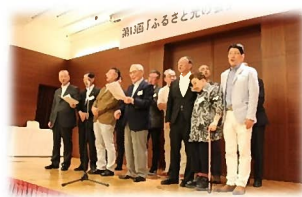
最後は恒例の「ふるさと」合唱 また来年お会いしましょう!!