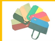
A-22 バイカラートート