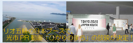
リオ五輪の日本ブースで、 光市PR動画「ひかりのまち」の放映が決定!