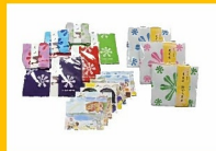
A-17 ふるさと光プロジェクト商品セット