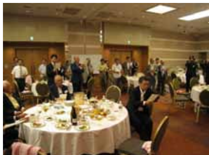
ふるさと光に思いをはせながら全員で「ふるさと」を合唱して、総会を締めくくりました。