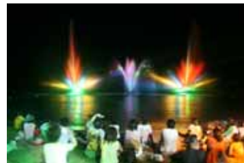
昨年のスターライトファンタジーの様子