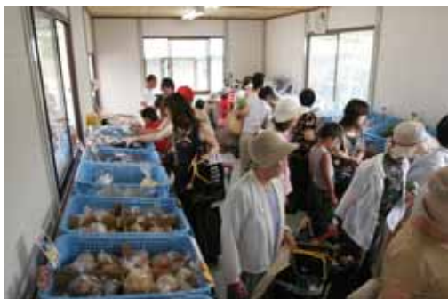
光市特産品直売パイロットショップ。新鮮で安全・安心な野菜をそろえてお待ちしております。

また、すぐ近くには、初代内閣総理大臣伊藤博文公の足跡が偲べる伊藤公資料館や、伊藤公自らが設計した伊藤公記念館などの名所もあります。