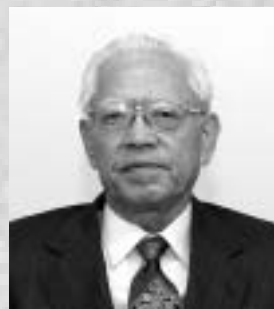
きよくじつそうこうしょう 旭日双光章