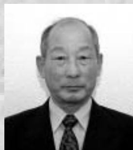
ずいほうしょうじゅしょう 瑞宝小綬章