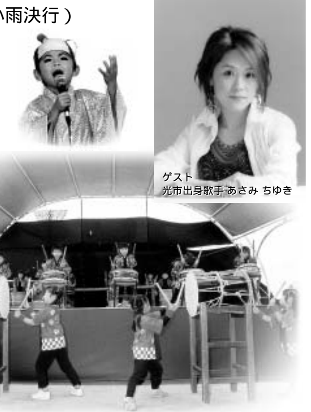
ゲスト 光市出身歌手 あさみちゆき