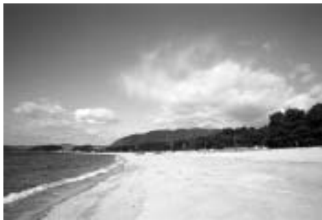
白砂青松の虹ヶ浜海岸

環境省自然環境局自然保護官が光市に来光したことに ついて 白い砂浜と青い松に抱か