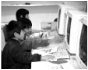
「地域情報化計 画」の策定に着 手します。

生涯学習の推進 地域づくり市民セ ミナーや生涯学習推進サポーター等に よる生涯学習活動を支援します。ま た、大和公民館は今年4月1日の開設 に向けて準備を進めていますが、地域