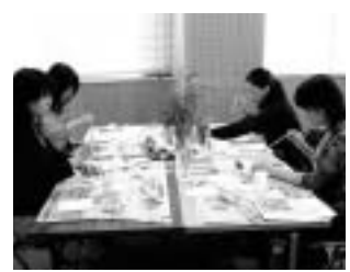
この協調を基本 に円滑な運営に 努めます。 さらに、新市 の「市民憲章」 は、制定委員会 を設置し、今年 9月頃の制定に 向けて準備を進めます。

生涯学習の推進 地域づくり市民セ ミナーや生涯学習推進サポーター等に よる生涯学習活動を支援します。ま た、大和公民館は今年4月1日の開設 に向けて準備を進めていますが、地域