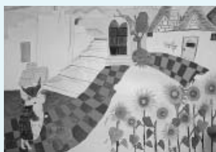
ダヤンが行ったイタリア