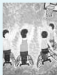
ゴールに向かって