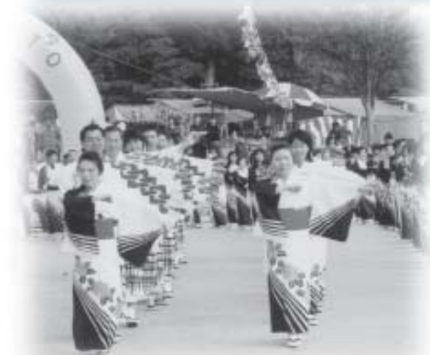
●当日、駐車場の混雑が予想されますので、臨時巡回バスをご利用ください。