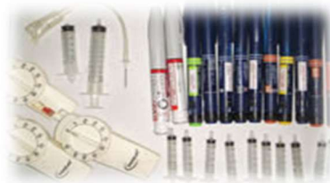
感染性医療廃棄物 (注射器など)

鋭利な部分をビニールや紙などに包んで保護したうえで、「危険」などと分かりやすく表示し、金属類 (緑色の指定袋) で出してください。