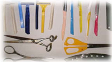
刃物類 (カミソリ、はさみ、包丁の刃など)

鋭利な部分をビニールや紙などに包んで保護したうえで、「危険」などと分かりやすく表示し、金属類 (緑色の指定袋) で出してください。