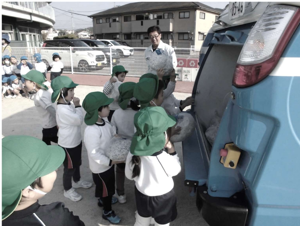
【令和6年12月：東光保育園での環境学習の様子】