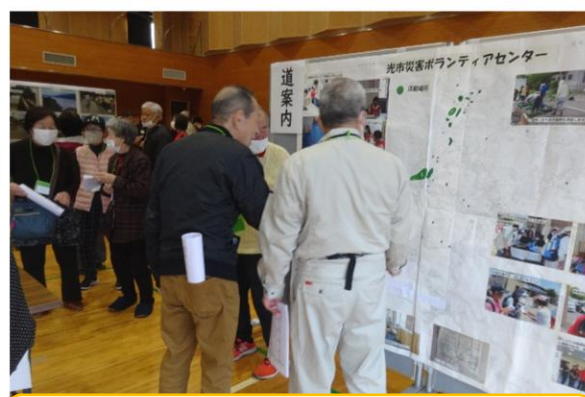
道案内…地元の方々による案内