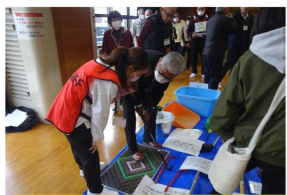
資材班…資材の管理と貸出