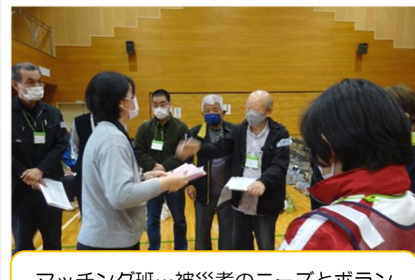
マッチング班…被災者のニーズとボランティアの結びつけ