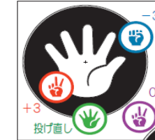
じゃんけんペタンコ