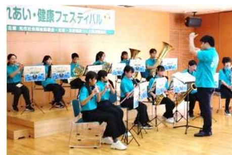
出店団体のブース