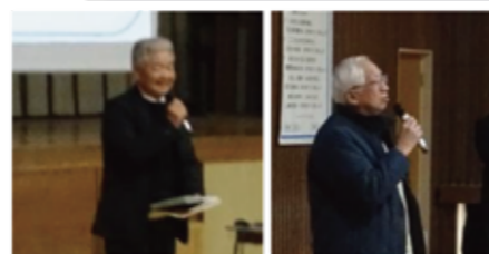
小・中学校運営協議会長挨拶