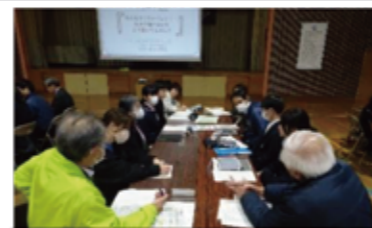
熱議後に全体共有しました