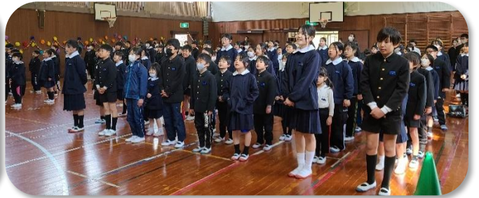
後ろから聞こえる元気な済んだ歌声に心があられました