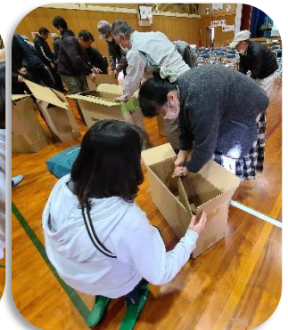
強度を上げるために段ボールの中に更に段ボールを入れます