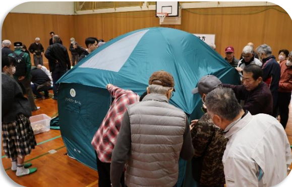
パーティション組立