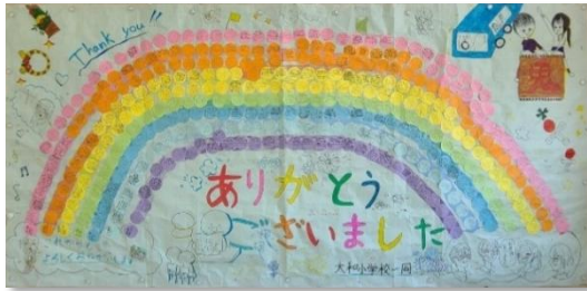
虹色に貼った全児童のメッセージ

3月11日(水)、大和小体育館でお世話になった地域の方々を招いて感謝の会が開催されました。東荷からは見守り隊と神舞保存会が招待され、上級生が劇やよさこいを披露した後、全児童で校歌を歌ってくれました。劇は「大きなかぶ」で、かぶがなかなか抜けず困っている時に、地域の方にいつも助けていただいていた事を改めて思い出し、これまでの活動の日々をスクリーンに映してふりかえりながら、最後に地域の方に「うんとこしょ！どっこいしょ！」と、掛け声をいただいでかぶを抜くというストーリーで、抜いたかぶには「大きなかんしゃ」と書かれているなど、凝った演出で楽しませてくれました。