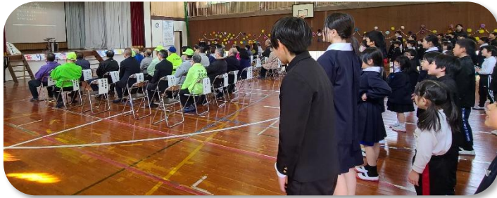
石城太鼓保存会やバスの運転手さん、読み聞かせの会等たくさんの方が招待されました