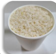
① 90ccの紙コップすり切り1杯のお米を湯銭用のビニール袋に入れます