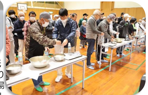
お米と水を紙コップで計量しました