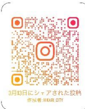
光市公式 Instagram QRコード