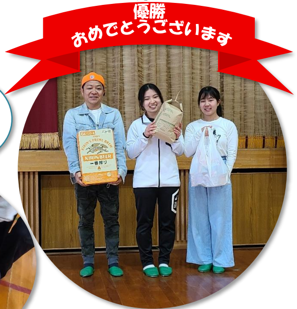
家族で参加の「Team Imoto」チーム