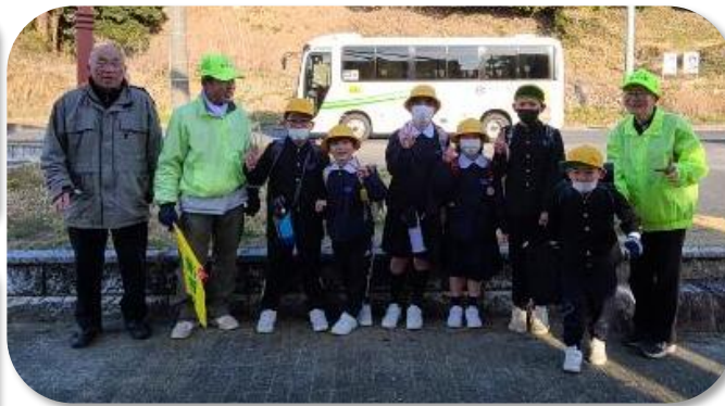
野尻スクールバス停