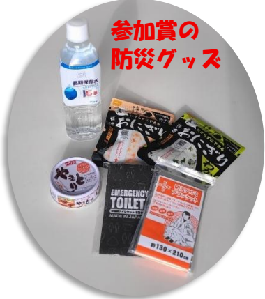
参加賞の 防災グッズ

光市共同募金委員会より助成を受けて、自主防災教室が旧東荷小体育館で開催されました。前回の防災教室は平成30年に実施しており、8年ぶりの開催でした。今回は光市防災危機管理課の職員の方による能登半島地震の避難生活についての講演を視聴した後、無洗米を使った炊き出しや段ボールでできた防災ベッドの組立、パーティションの組立などを体験していただきました。参加者は各自治会の自主防災組織の方々や希望者の計64名。避難生活の過酷な現実について視聴して、被災者だけでなく災害関連死された方の多さに驚きと震災の怖さを改めて感じると同時に、今できることは何かを考えて備えていくことの大切さを痛感した教室でした。