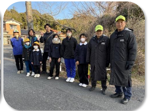
新市スクールバス停