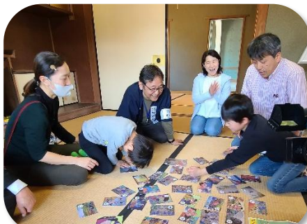
見つけた取り札に素早く手を出す児童