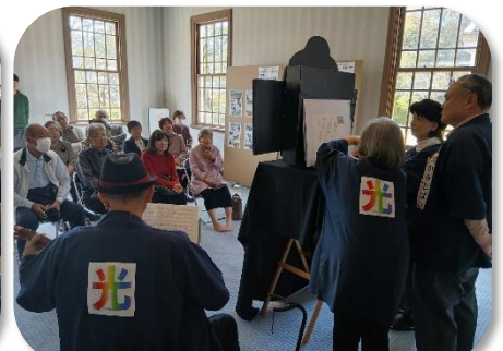
光紙芝居2話を披露