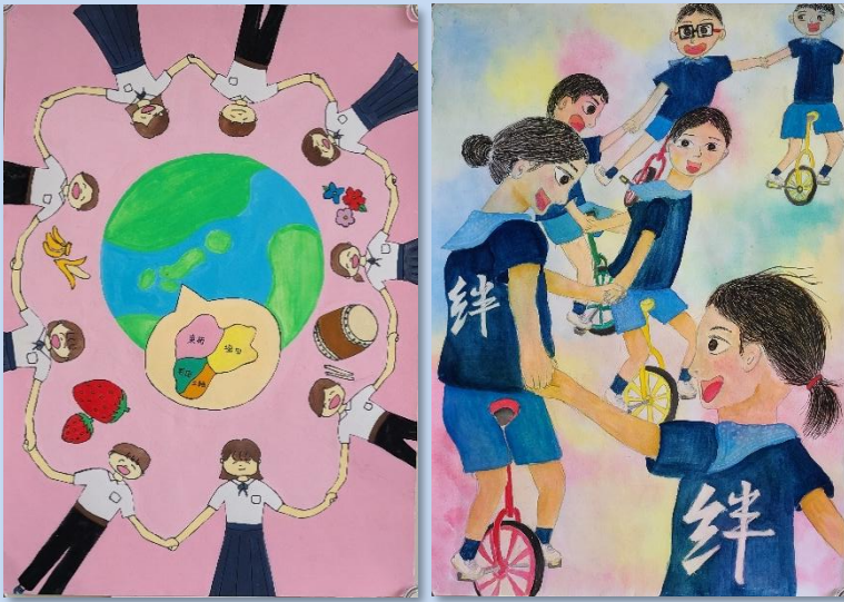
藤井 萌名さんの作品