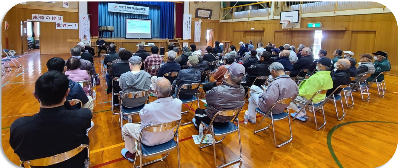
能登半島震災後の避難生活についての講演