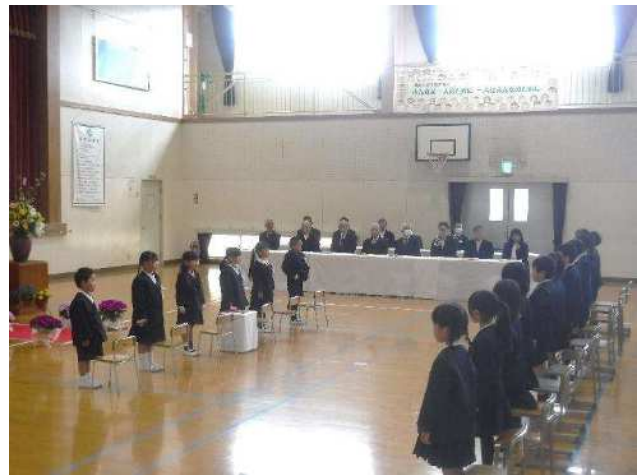
【4月9日(木) 入学式の様子】

4月9日(木)、学校運営協議会委員の皆様を含む13名のご来賓、並びに保護者の皆様のご臨席を賜り、6名の新入生を迎え、入学式を無事に挙行することができました。これからの「周防っ子」としての成長と活躍が大いに期待されます。