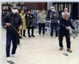
ラダーゲッターを楽しむ参加者

わが、シニアクラブも桜満開であろう4月4日に花見を予定していましたが、涙雨になってしまいました・・・