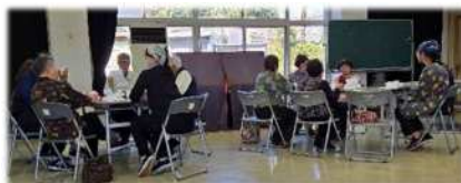
和気あいあいと食事を楽しむ様子

4月5日(日)、周防コミュニティセンターで、周防たまりば食堂が開催され、地域住民が交流しました。 昨年10月にスタートし、今回が4回目。地域住民にも浸透してきているようです。 次回は6月14日(日)の予定です。