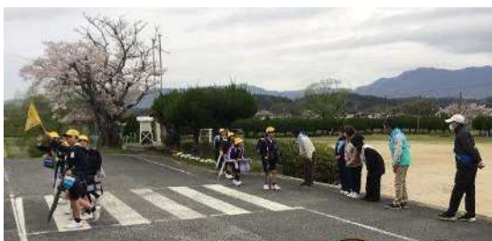
4月9日(木) あいさつ運動