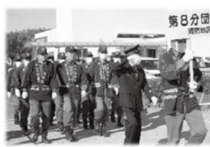
分列行進する8分団