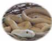
祀られている白蛇