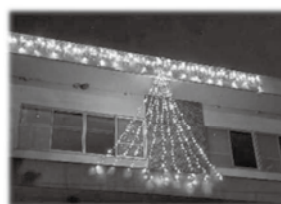
きらびやかに光る イルミネーション

今年は華やかなイルミネーションを楽しんでもらおうと、例年より、設置期間を長めにし、新たにイルミネーションライトを増やし設置しました。