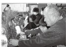
真剣に門松を作る皆さん

令和 6 年 12 月 27 日 (金)、放課後子ども教室『チャレンジキッズ』で、毎年恒例のミニ門松を作りました。