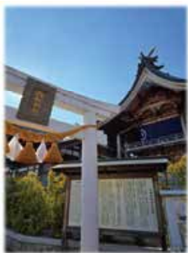
岩国白蛇神社 (岩国市今津町)