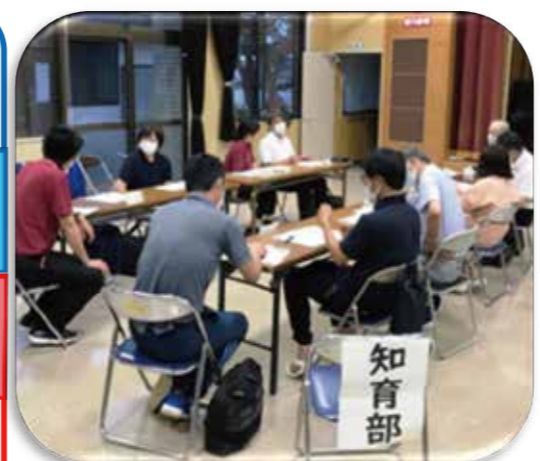
部会での協議の様子

【保】 子どもと一緒にラジオ体操をする。※家庭の都合に合わせてゆとりをもって行う。 【地】 みついの日に学校に来てラジオ体操をする。※時間帯などについては、これから調整。いずれ中学生が企画や宣伝等に関わる。