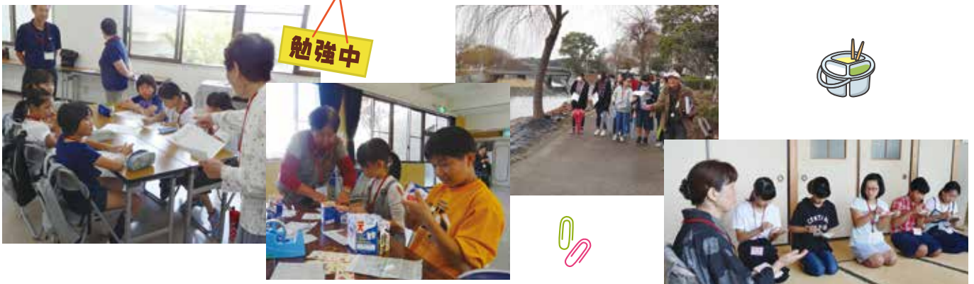
※活動紹介の写真は過去のもを掲載しています。