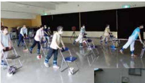
↑ 脇田いきいきサロン