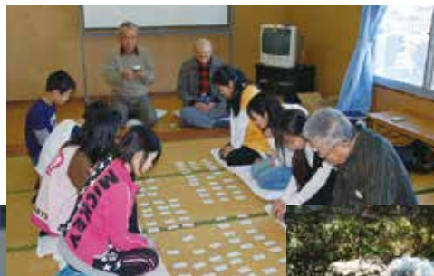
←サロン グリーンヒル