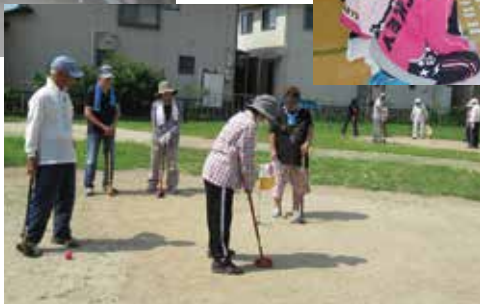
御崎いきいきサロン→