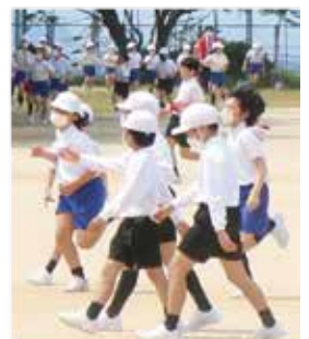
3か月ぶりの休み時間