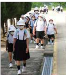
久しぶりの集団登校

休業期間の大変な中、保護者の皆様方が支え続けてくださったおかげです。この場をお借りしてお礼申し上げます。ありがとうございました。