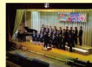
※写真はいずれも昨年度