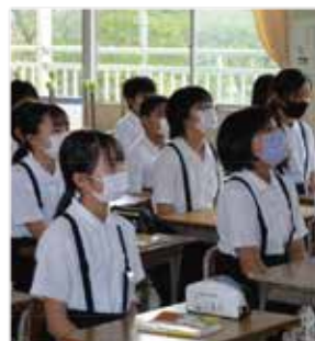
放送による始業式