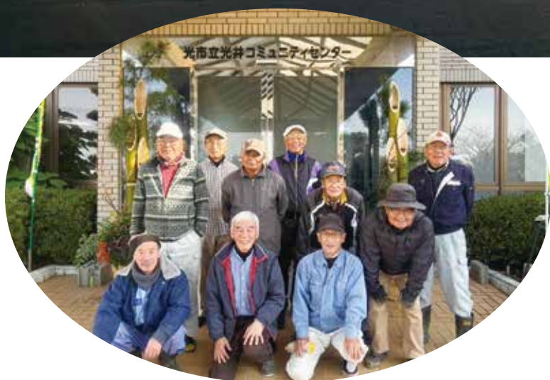
コミュニティセンターに門松が設置されました