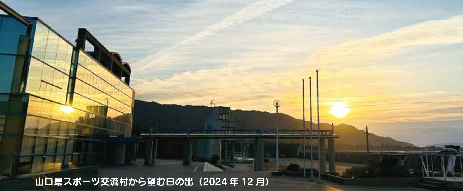
山口県スポーツ交流村から望む日の出（2024年12月）