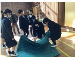
ファミリールーム設置