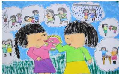
大切な人とのやくそく