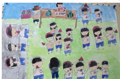
みんなでそだてたスイカを食べたよ