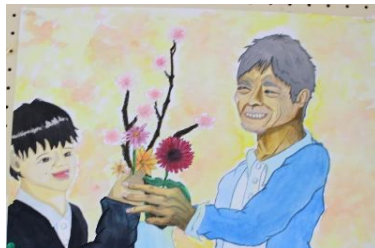
Smiles create bonds