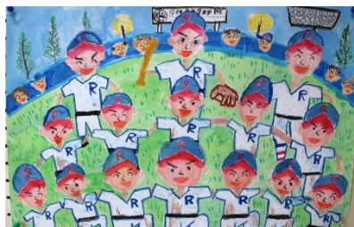
絆スタジアムで仲間とがんばったよ!