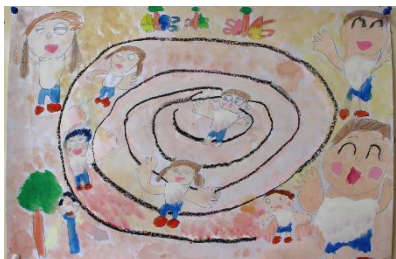
遠足でふかまったきずな