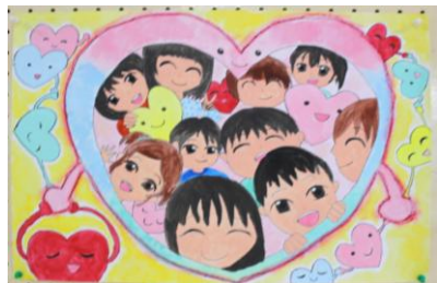
みんなのきずなをつなげていこう