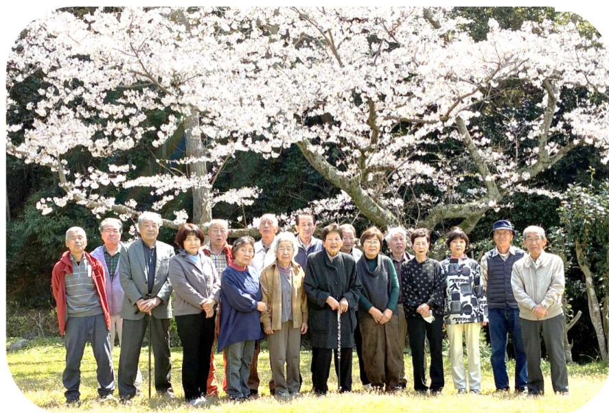
桜を背に記念撮影。毎年の定点観測です。