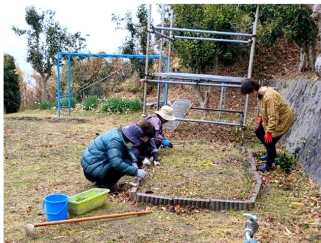
春に向け花壇の手入れ