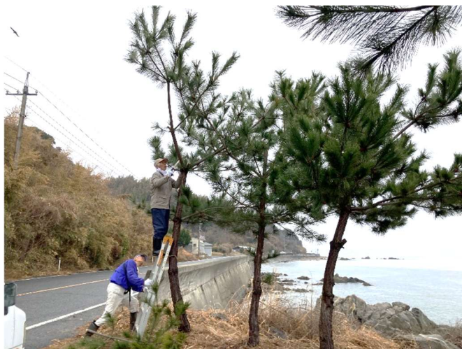
「二本松」で、松の剪定

2月15日（土）9時からコミュニティセンター周辺の環境整備を実施しました。コミセン法面の支障木の伐採、花壇づくり、「二本松」再生を願って植えた5本の松の剪定を行いました。参加された18名の皆様お疲れさまでした。