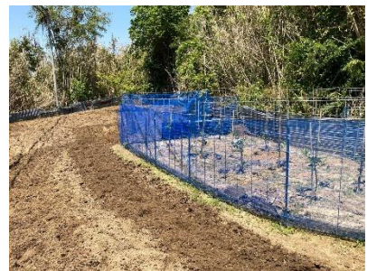
遊休農地をかんきつ園に活用