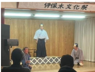
伊保木座文化祭公演に出演