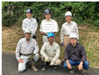
室積伊保木竹の会で竹林整備