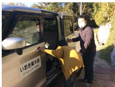
らくらく号で交通弱者を支援