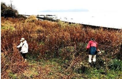
ドライブイン燈東側