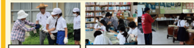
花壇作りボランティア