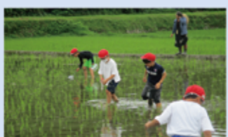
2年「生きものさがし」

体験を通して、「何事にも関心をもって関わり、様々なことに自分なりの気づきを持ち、学ぶことが楽しいと感じる子ども」を、そして、仲間と話し合いながら、「知恵を出し合い、問題解決に取り組み、自分の学びや成長を実感できる子ども」をめざしています。