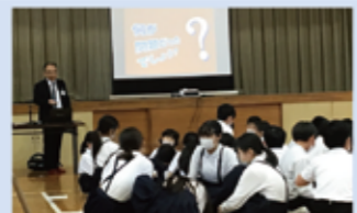
6年「情報モラル教室」