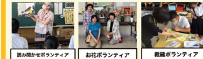
読み聞かせボランティア