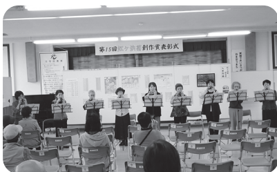
オカリナ教室の発表

なお、この福祉バザーの収益金七万四千五百円は浅江地区社協に託され有益に使われます。物品を提供された方、お買い上げいただいた方、ご協力ありがとうございました。