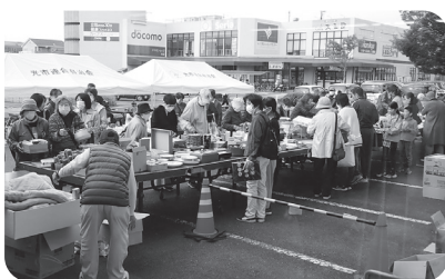
大盛況の福祉バザー