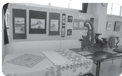
日本画など一般作品を展示